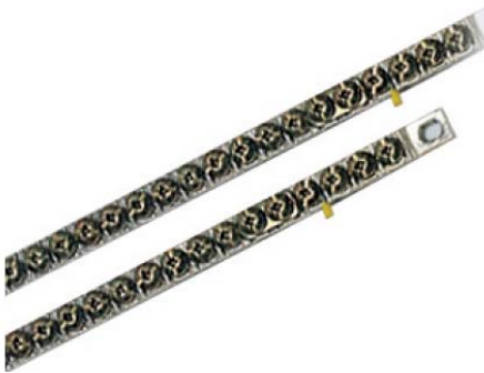
Immagine prodotto Product image